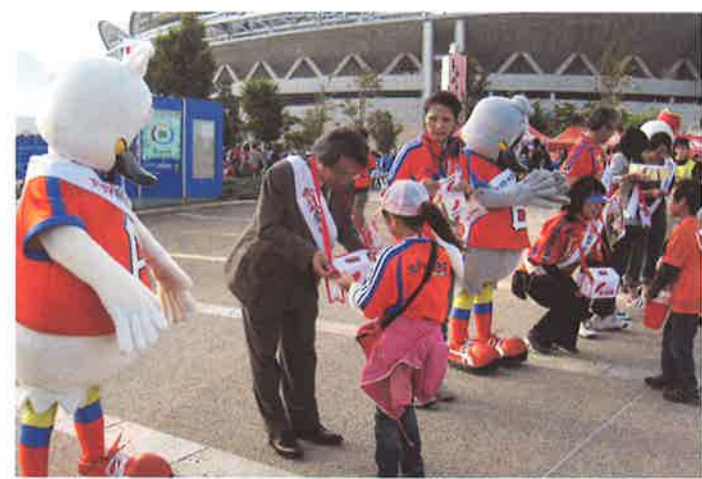
10月17日(土) 東北電力ビッグスワンスタジアムにて

皆様からご協力いただいた募金は、地域や社会福祉施設、社会福祉協議会などが行うさまざまな事業に役立てられています。【募金箱設置ご協力先】 大和新潟店・ラブラ万代・イオンラブラ万代店・パワーズフジミ(山ノ口店、笹口店、近江店)・第四銀行各支店・北越銀行各支店